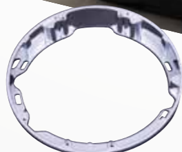
■レイクライトベゼル クロム #HB2-C ¥24,516 ブラック #HB2-B ¥24,516