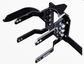
■アジャスタブルフェアリングマウント 15年以降TR 23"/26"/30"ホイール用 #FM15N-A ¥66,960