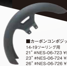
■カーボンコンポジットフェンダー 14-19ツアリング用 21" #NES-06-723 ¥54,648 23" #NES-06-724 ¥54,648 26" #NES-06-726 ¥54,648