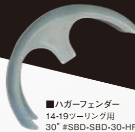
■ハガーフェンダー 14-19ツアリング用 30" #SBD-SBD-30-HF-14-C