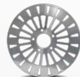
Classic Style 1-Piece Rotor